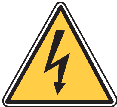
Znak za opasnost od visokog napona